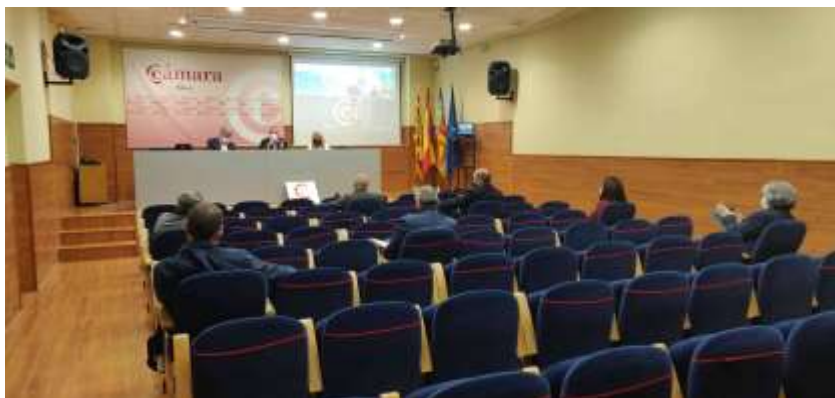
09/04/2021. Grupo de Trabajo Infraestructuras con representantes del Ayuntamiento de Alcoy.

Entre los Comités Ejecutivos y los Plenos de los miembros de la Cámara se realizaron 18 reuniones programadas en el año 2021, asistiendo además de las empresas, la Consellería de Comercio como entidad tutelante de la Cámara.