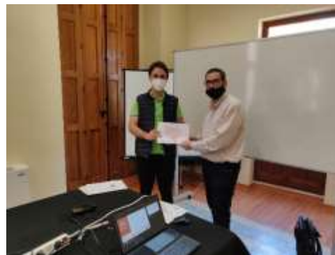
26/03/2021 - Entrega de diplomas, Formación Troncal de PICE.