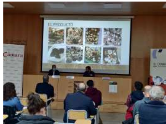
Jornada desarrollada en el marco del Convenio del Consejo de Cámaras de la Comunitat Valenciana con Turisme Comunitat Valenciana