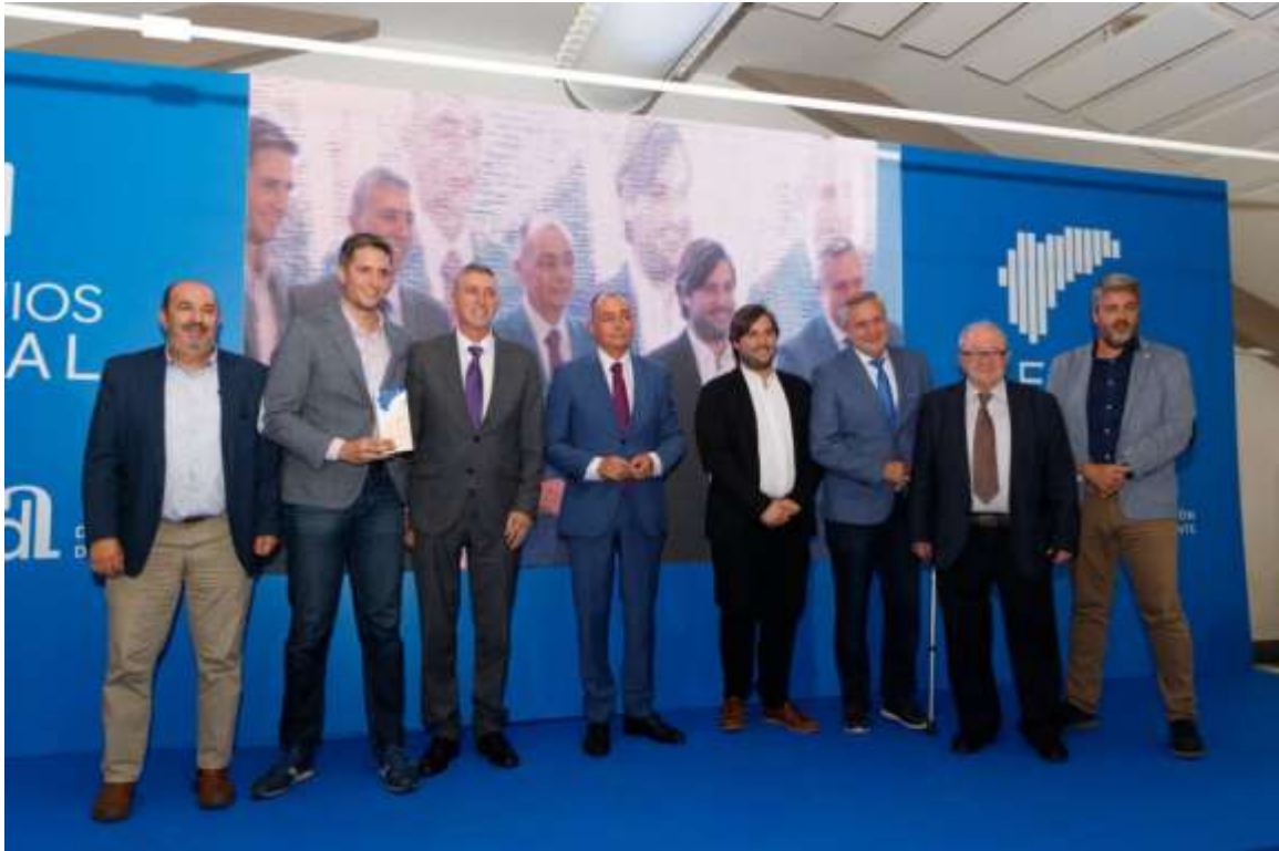
27/10/2021. El presidente de la Cámara participa en el acto organizado por UEPAL. Entrega de premios a JOVEMPA L'Alcoià-Comtat.

Además, mantiene una relación constante con los agentes económicos y sociales de Alcoy y comarca, ofreciendo apoyo y colaboración en cada caso.