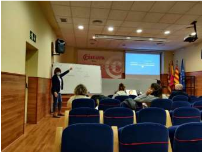
“Formación económico financiera para comerciantes”

23/11/2021 – “Turismo Micológico en la provincia de Alicante”